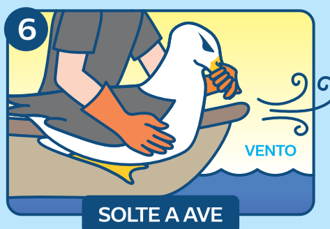
SOLTE A AVE

Se possível, coloque-a em uma caixa ou recipiente ventilado num lugar à sombra, tranquilo e seco para que ela se recupere por uma ou duas horas. Do contrário, coloque-a em um lugar seco e tranquilo, longe do óleo. A ave estará pronta para ser liberada quando as penas estiverem secas, e ela estiver alerta e puder ficar de pé.