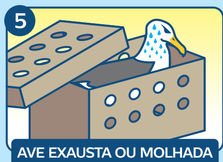
AVE EXAUSTA OU MOLHADA

Não remova o anzol. Caso já tenha sido engolido ou a remoção possa causar mais danos na ave, corte a linha o mais perto possível do bico e deixe o anzol dentro da ave.