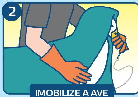
IMOBILIZE A AVE

Se possível, diminua a velocidade ou pare a embarcação para afrouxar a tensão da linha. Se for possível, utilize um puçá para trazer a ave a bordo, ou recolha a ave na linha da forma mais segura e cuidadosa possível. Evite pegar a ave pelas asas e pescoço.