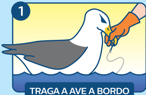
TRAGA A AVE A BORDO

• TOALHA/COBERTOR • FACA • REDE • CAIXA/RECIPIENTE • ALICATE/CORTADOR DE PARAFUSO • LUVAS