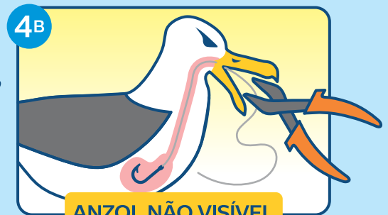
ANZOL NÃO VISÍVEL

Utilize um alicate (ou cortador de parafusos para os anzóis grandes) para cortar o anzol (ou para cortar as farpas). Retire o anzol puxando-o para trás e para fora da ave.